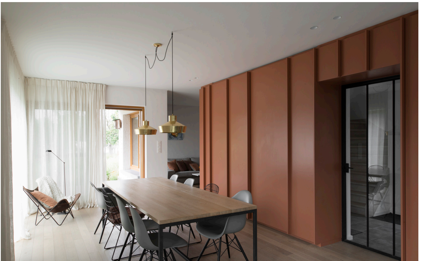
Bouwcenter Dils leverde de vloertegels in onder meer de keuken. Ook de wandtegels in de badkamer, het lamelparket en de marmeren tabletten zijn van hen afkomstig.